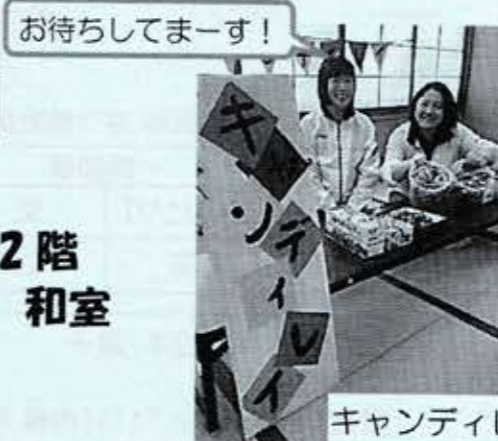
お待ちしてまーす!