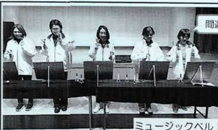
間違えてないよ!(笑)