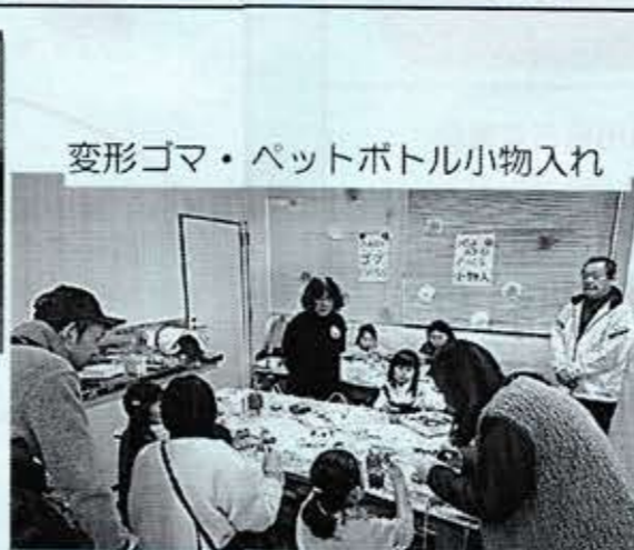
変形ゴマ・ペットボトル小物入れ