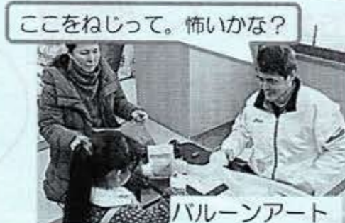
ここをねじって。怖いかな?