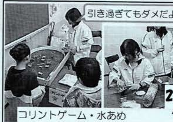
引き過ぎてもダメだよ!