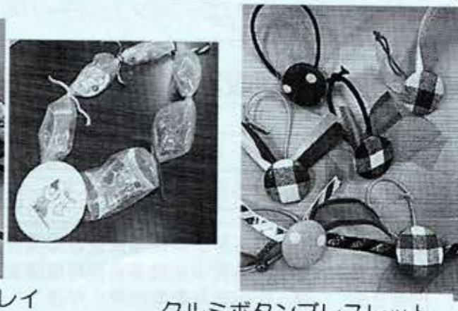
クルミボタンプレスレット