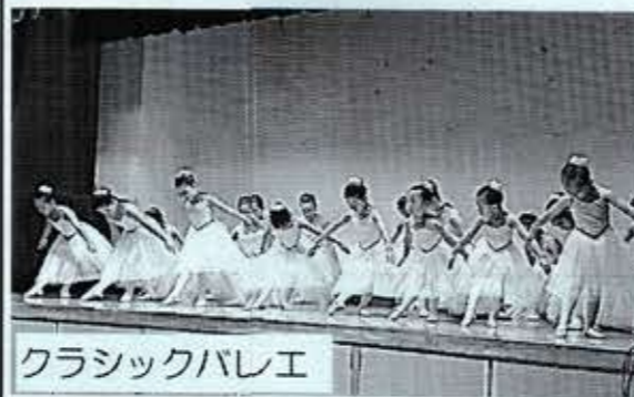
クラシックバレエ