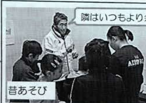
隣はいつもより余計に回してるよ!