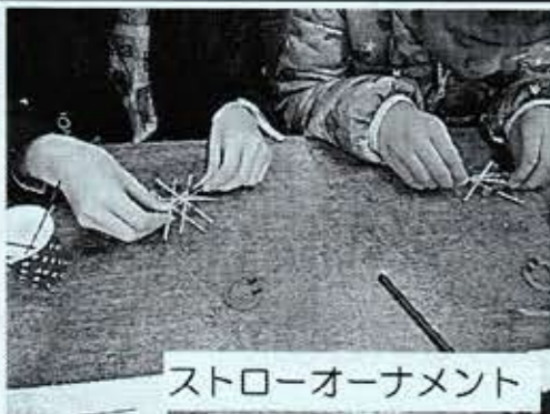
ストローオーナメント