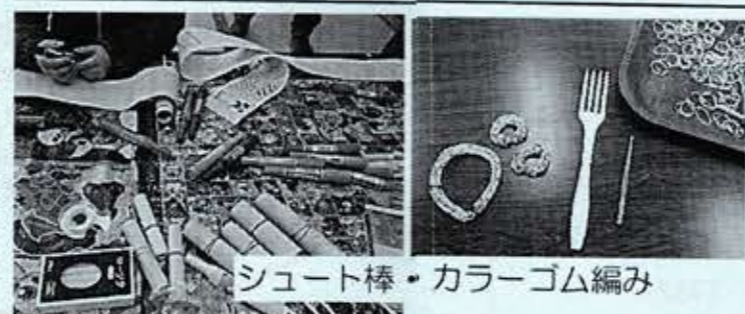
シュート棒・カラーゴム編み