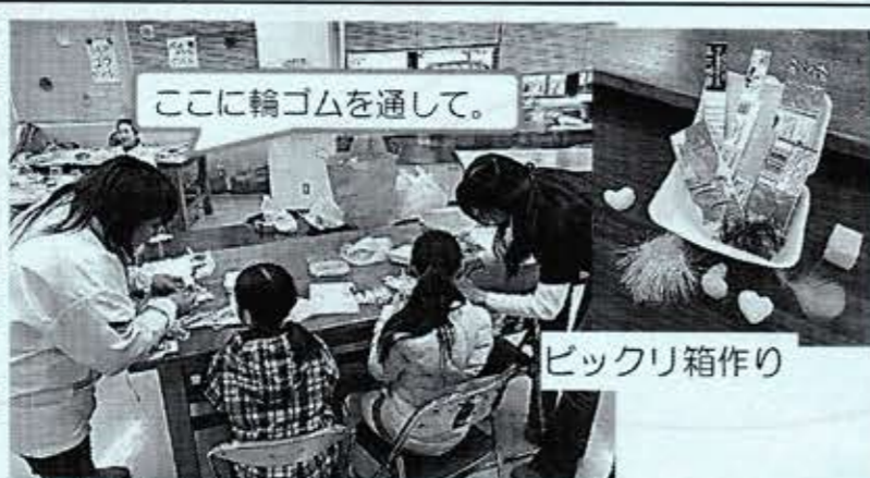
ここに輪ゴムを通して。