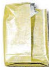
たばこの銀紙・金紙