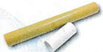
ラップ・アルミホイル・トイレットペーパーの芯