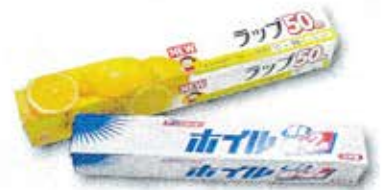
ラップの箱 ※金属部は「燃やせないごみ」