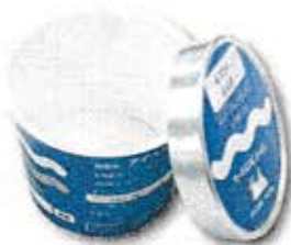
アイスクリームのカップ