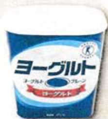
ヨーグルトの容器