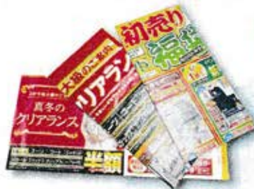
ダイレクトメール

● 雑紙とは 家庭から出される古紙のうち、新聞、ダンボール、本・雑誌、シュレッダーで裁断した紙、飲料用紙パックのいずれの区分にも入らない紙をいいます。