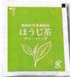
ティーバッグの袋