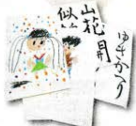
習字やクレヨンで描いた紙

その他、アイロンプリント紙、感熱発泡紙（熱を加えると盛り上がる紙）なども、燃やせるごみに出してください。