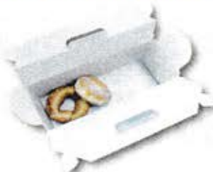
ドーナツやケーキ等の入った箱