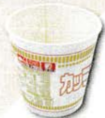
カップ麺のカップ