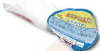
裏がアルミ貼りのお菓子の箱 お菓子やカップ麺のふた