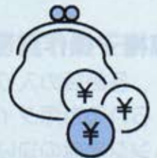
生活費 どうしよう...