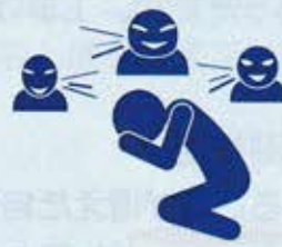
学校生活 いじめが...