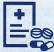
健康・医療 心配で...