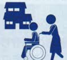
福祉サービス 教えて...

茅ヶ崎市の民生委員・児童委員は、自治会長が内 申し、市の推薦会において、地域住民の中で、社会 福祉に熱意があるなど、一定の要件を満たした人 が選ばれます。茅ヶ崎市では、328人の民生委員・ 児童委員が担当区域で活動しています。 担当の民生委員・児童委員が分からないときは、茅 ヶ崎市役所の福祉政策課へお問い合わせ下さい。