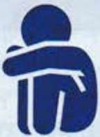
一人暮らし 心細い...