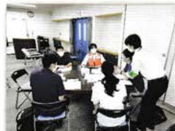
▲活発な意見交換会