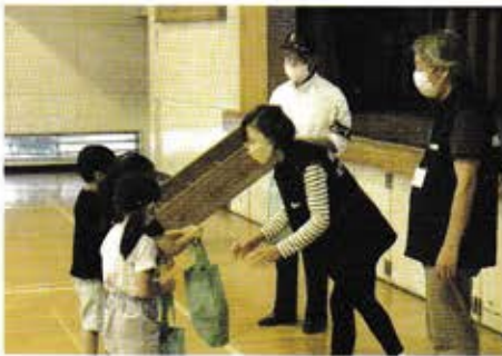
▲「ミニランドセル贈呈式」の様子 座間市立中原小学校にて