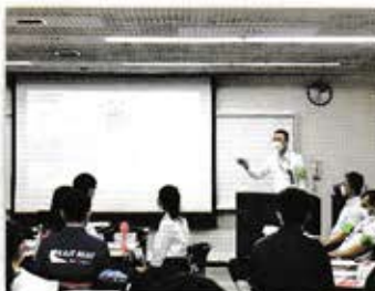
▲県警による講演の様子

当日は、41名の大学生・高校生が参加し、県警の特殊詐欺についての講演や参加者相互の意見交換会を通して、防犯活動に関する知識の習得や技術の向上を図りました。