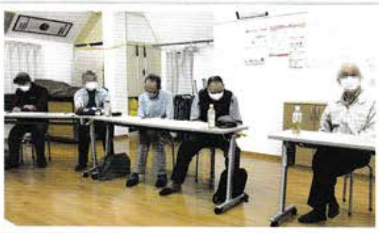
▲「防犯カメラ運用委員会」会合の様子

近年は高齢化等により地域防犯の担い手が少なくなっていますが、防犯カメラの設置を基軸に今後も一層地域と警察の連携が推進されていくことを期待しています。