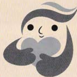
犯罪被害者等支援 シンボルマーク 「ギョウとちゃん」