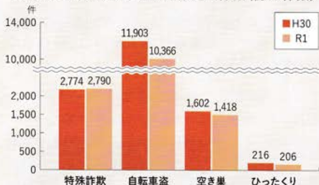
H30/R1(暫定値)身近な犯罪発生件数(認知件数)

令和元年中の県内刑法犯認知件数は、約42,000件で、平成30年と比較すると約10.7%減少しましたが、特殊詐欺は前年に引き続き過去最悪を更新しました。