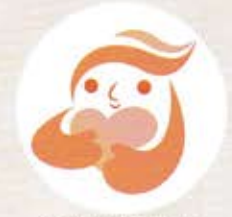
犯罪被害者等支援 シンボルマーク 「ギョっとちゃん」

お話をお伺いしたうえで、どうしたらよいか、一緒に考えます。 ひとりで悩まず、まずはご相談ください。