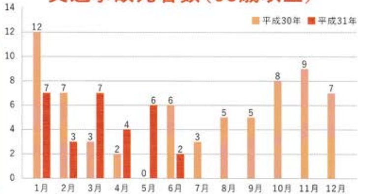
交通事故死者数(65歳以上)

交差点での信号無視や横断歩道のない道路を無理に横断すると大変危険ですから絶対にやめましょう！