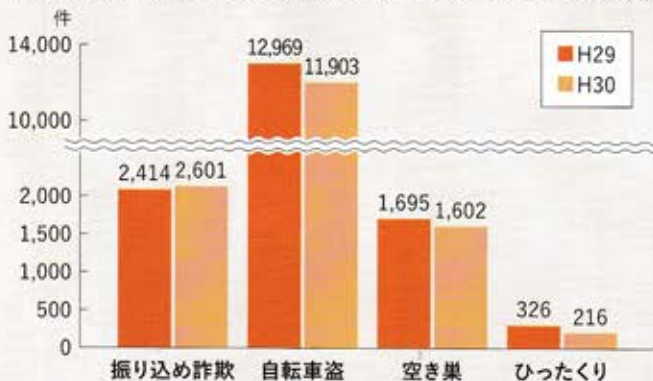
H29/H30(暫定値)身近な犯罪発生件数(認知件数)

平成30年中の県内の刑法犯認知件数は、約47,000件で、平成29年と比較すると約12.8%減少しましたが、振り込み詐欺は前年に引き続き過去最悪を更新しました。