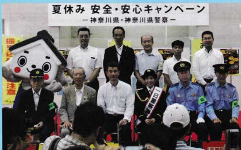
夏休み 安全・安心キャンペーン — 神奈川県・神奈川県警察 —