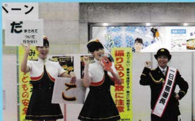
パーン だ まこれて ついて 行かない み

歌手の大山愛未さん(元SDN48)を戸部警察署の一日警察署長としてお招きし、夏休み安全・安心宣言をしていただくと共に子どもたちの安全を守るため「おおだこポリス」のダンスと神奈川県警PRソング「みんなで仲良くパトロール」を披露していただきました。