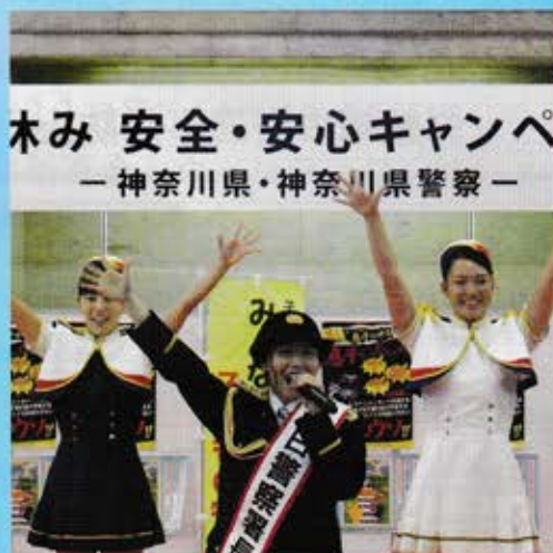
木み 安全・安心キャンペ — 神奈川県・神奈川県警察 —