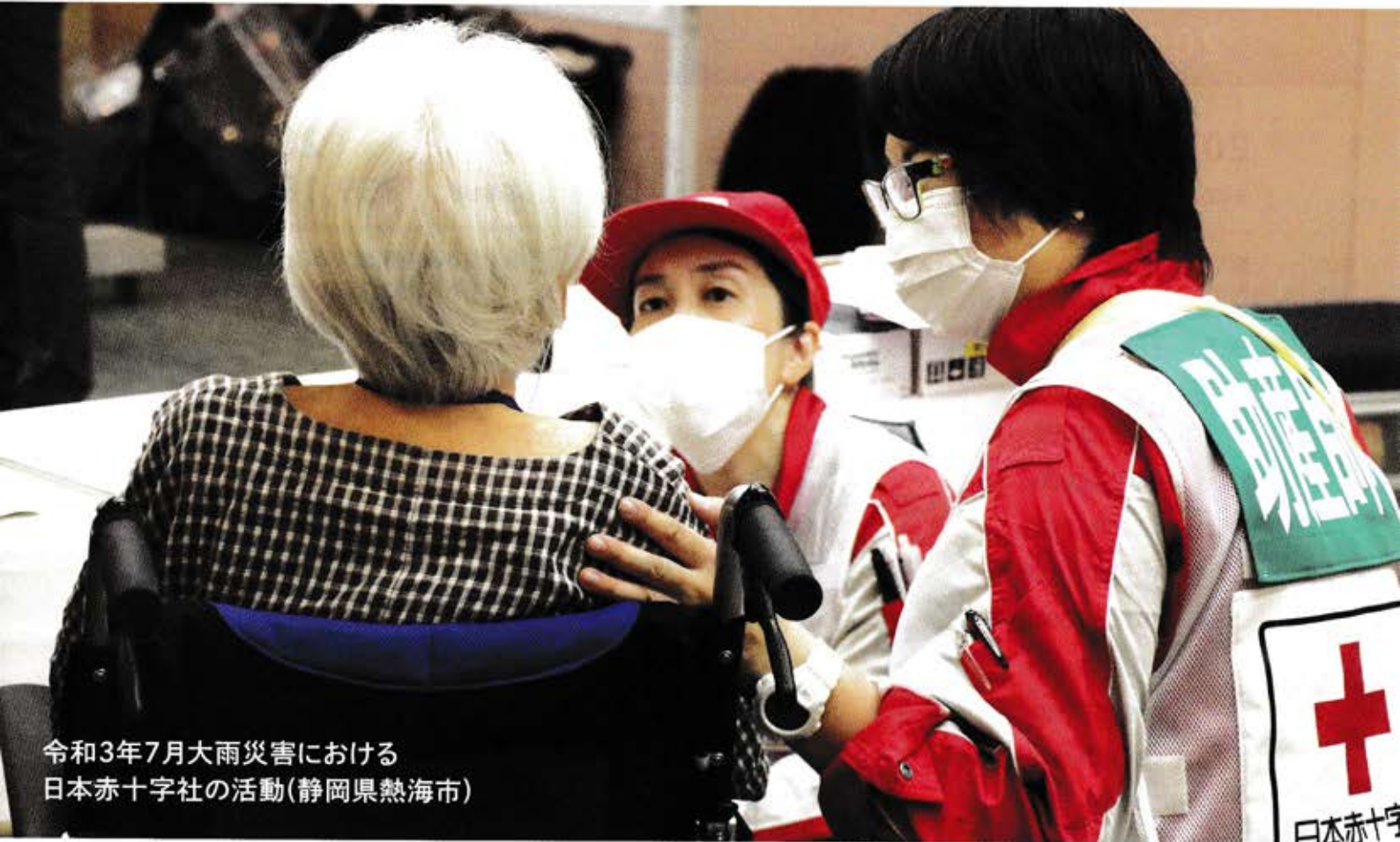
令和3年7月大雨災害における 日本赤十字社の活動(静岡県熱海市)