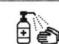
手指消毒用アルコール による消毒の励行

新型コロナワクチンの有効性・安全性などの詳しい情報については、厚生労働省ホームページの「新型コロナワクチンについて」のページをご覧ください。