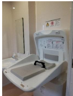
トイレには オムツ交換台も完備

おひとりの方も、お友達連れの方も 大歓迎です♪ ぜひ一度、遊びに来てみてください。 スタッフ一同、お待ちしております！