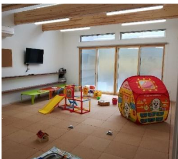
吹き抜けで明るく ゆったりと過ごせます