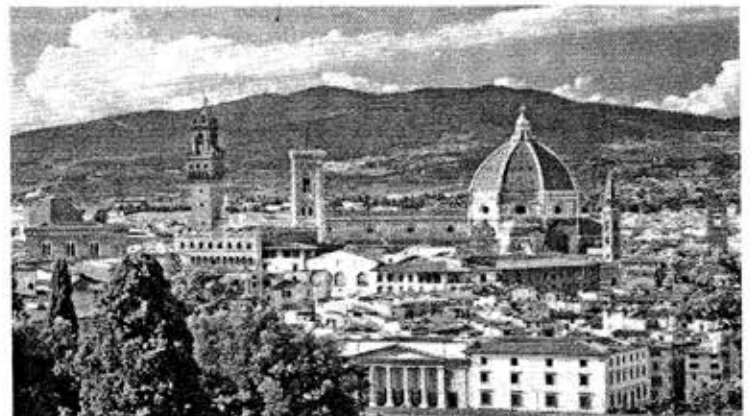
世界遺産(イタリア編③): 建築物—フィレンツェ歴史地区