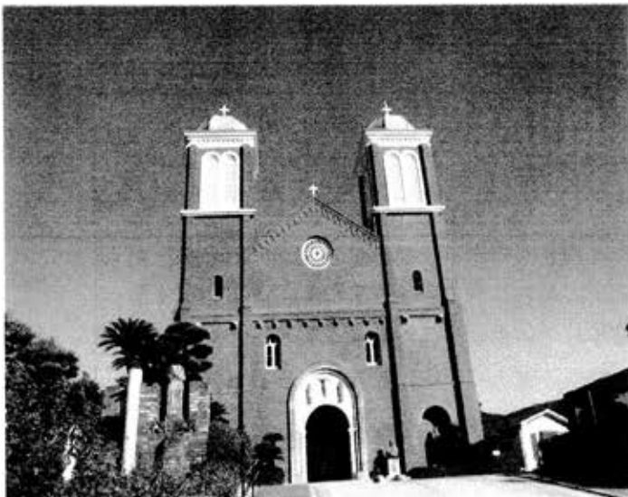
世界遺産—日本シリーズ：長崎 浦上天主堂

私は、1月末に大量下血をし、4日間、湘南東部総合病院に検査入院した。59人のコロナクラスターが発生した時である。今から思えば、違う病棟でよかったと思う。処置で下血は止まったが、その事を友人にメールしたところ、病気持ちの友人から、つぎつぎにメールが入った。皆、経験談とアドバイスが多く、逆に友人たちが私よりも病気持ちであることもわかった。それ以後、たびたびアドバイスしてもらうようになり、病友として認められたようである。あまりうれしいことではないが、病気により友人たちとさらに共感と連帯感が高まったことは確かである。