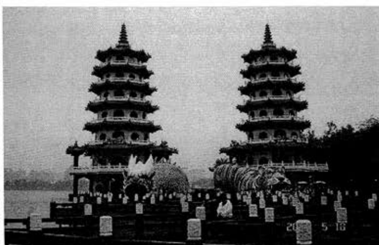
台湾南部高雄：慈濟宮の塔

・茅老連報告：①令和3年度の主な行事は、新型コロナウイルス感染の終息が不透明なため現時点では不明。分り次第報告する。