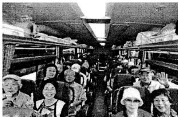
沢山のお土産買い込み一路家路に!

民族大移動の旅に竹田会長以下13名参加。天気はまあまあの日和でした。食べ放題のブドウ腹をワサビでかき回し、ほうぼうのカラ揚げを詰め込み、ソフトクリームで冷やし、胃はガタガタ。ナスにトウモロコシに桃に岩塩などをお土産としてもらい、リュックサックの人もいたが、さながら戦時中の買い出しの様相。昇仙峡の散策は30分程度。観賞欲より、食欲、買い物欲の方が勝ったのか、それでもお土産沢山で、ニコニコ顔で帰還した。皆さんお疲れ様。(田中 記)