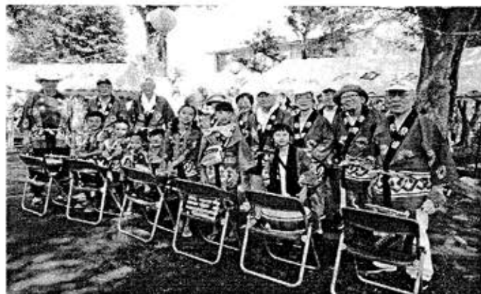
御神輿、お囃子車の巡行出発、