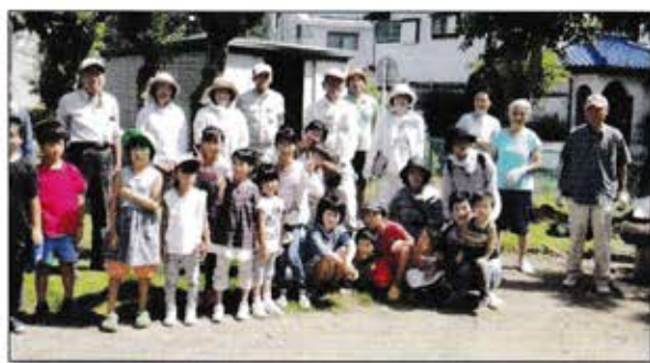
公園の雑草取り 住民参加の公園整備 (随時)