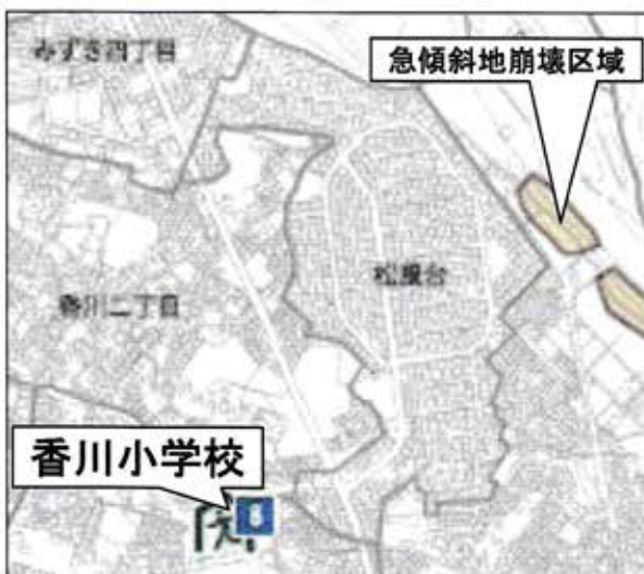
洪水・土砂災害ハザードマップ（抜粋）

下の図は松風台周辺の洪水・土砂災害ハザードマップおよび液状化ハザードマップの抜粋です。次ページ以降は「大地震発生時の防災行動指針」および「避難する場合の〈経路〉と〈場所〉」です。